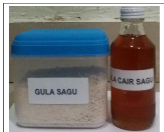
Salah Satu Bentuk Hasil Pengabdian Pembuatan Gula berbasis Sagu

Pengabdian kepada masyarakat seharusnya merupakan hilirisasi dari penelitian. Hasil penelitian baik sains dan teknologi (khususnya teknologi tepat guna) maupun kajian sosial dan ekonomi. Pengabdian merupakan salah satu cerminan keberhasilan pelaksanaan tridarma bagi perguruan tinggi. Sehingga